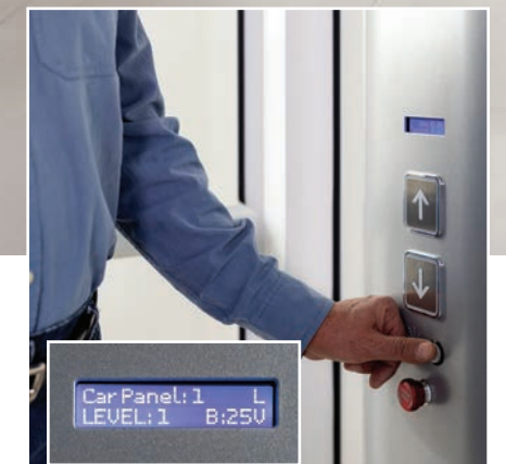
Fonctionnement simple et intuitif avec panneau à cristaux liquides d'état du Luma à l'intérieur de la cabine